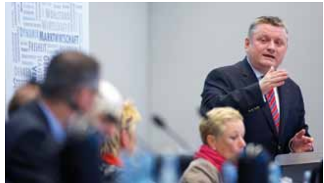
Hermann Gröhe MdB, Bundesminister für Gesundheit.